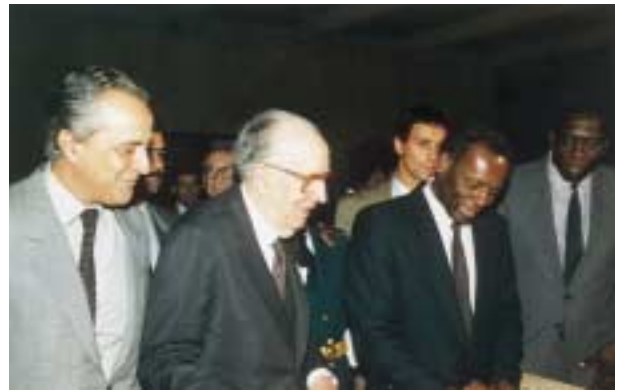
1987 – Com o Presidente angolano José Eduardo dos Santos e José de Azeredo Perdigão