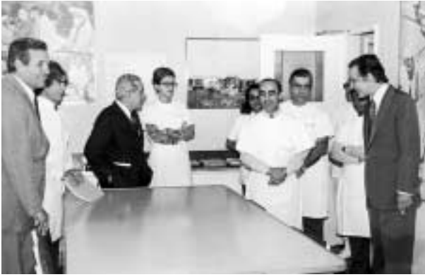
Agosto de 1973 – Visita ao Serviço de Oftalmologia do Hospital Central Miguel Bombarda de Moçambique.