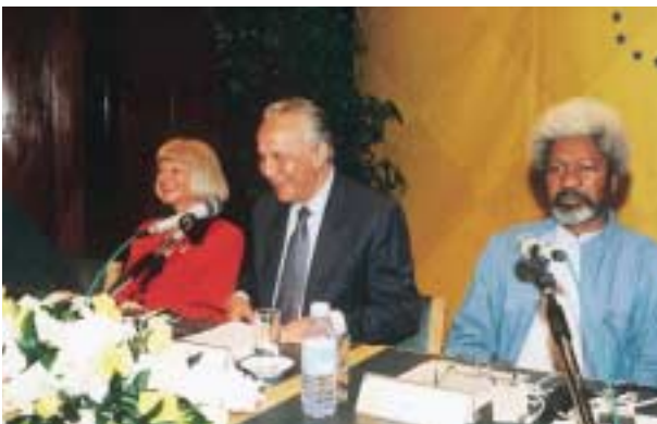
Maior de 1998 – Seminário Internacional “Europa e Cultura”, entre Michèle Gendreau e Wole Soyinka.