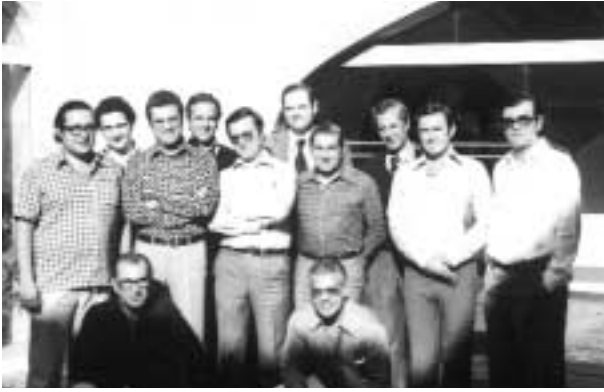
Reunião dos fundadores do CDS em Sesimbra.