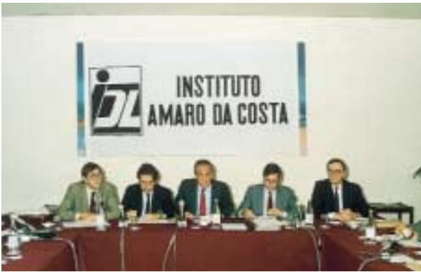
Conferência no IDL – Instituto Amaro da Costa, de que foi presidente.