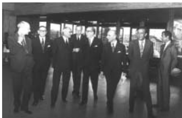
1969 – Visita de Marcelo Caetano à Sede da Fundação.