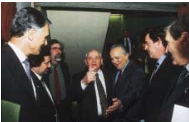
Abril de 2000 – Conferência presidida por Mikhail Gorbatchov na Fundação, no 10º aniversário do jornal “Público”.