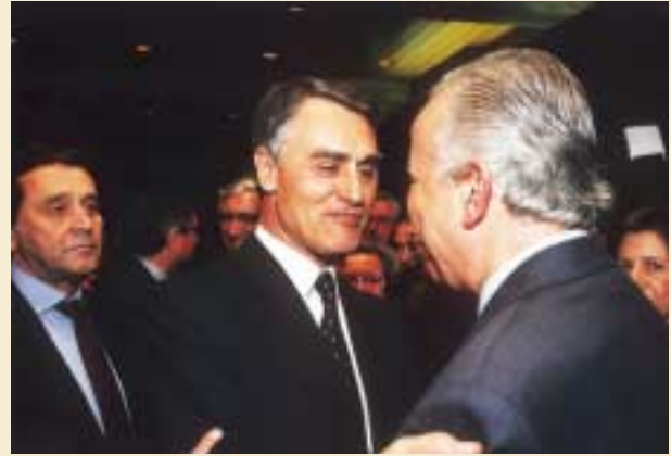
Aníbal Cavaco Silva e José Fonseca e Costa na sessão de cumprimentos.

“[...] Assumimos a presidência e a administração da Fundação em condições de liberdade e independência totais, sem que sobre nós se exerçam quaisquer ilegítimas pressões. Gozamos de um relacionamento fácil, cordial e civilizado com o Governo da Nação, que em nós vê uma polarização e um protagonista importante da sociedade civil e que por saber que a missão de interesse público eminente que prosseguimos só pode cumprir-se cabalmente em condições de completa liberdade e independência, as respeita e protege.