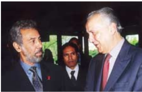
2000 – Visita de Xanana Gusmão à sede da Fundação.