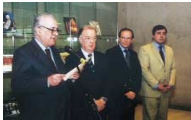
Julho de 2001 – Reabertura do Museu Gulbenkian, estando presentes o Presidente da República, Jorge Sampaio, o Ministro da Cultura, Augusto Santos Silva, e o Secretário de Estado da Cultura, José Conde Rodrigues.