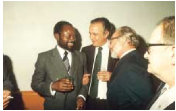
1983 – Com o Presidente moçambicano Samora Machel.

Victor de Sá Machado proferiu conferências nas seguintes instituições: Instituto de Defesa Nacional (Lisboa e Porto); Instituto de Altos Estudos Militares (Lisboa); Academia Militar (Lisboa); Universidades de Lisboa (ISE-CEDEP) e Universidade Católica (CEPCEP), em Lisboa; Universidade Nova de Lisboa; Universidade do Porto; Universidade Aberta; Universidade