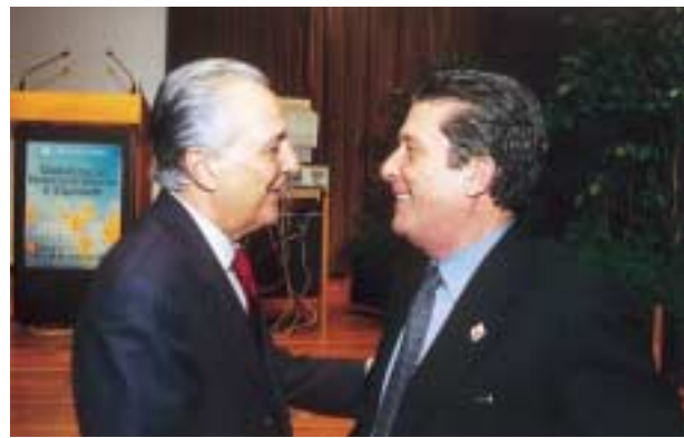
Junho de 2000 – Com Frederico Mayor na Conferência internacional “Globalização, Desenvolvimento e Equidade”.