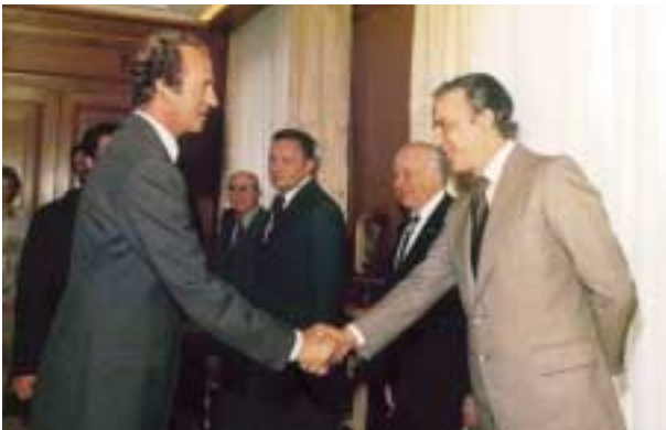
Maio de 1978 – Com o Rei de Espanha Don Juan Carlos.