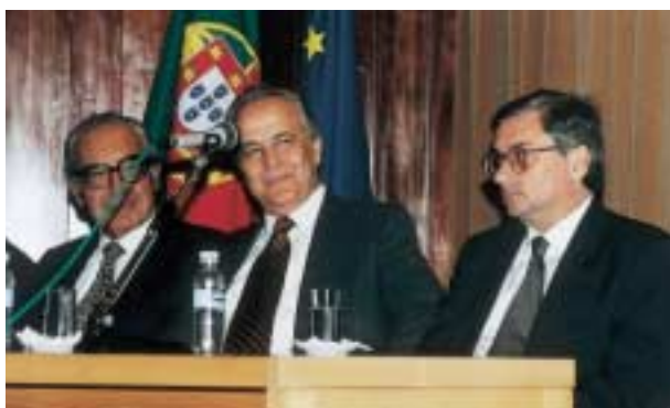
Maio de 1999 – Com o Presidente da Assembleia da República, Almeida Santos e Eduardo Marçal Grilo, na sessão solene de abertura da exposição “A Fundação e os 25 anos de Eleições Democráticas”.

Director do Serviço de Educação e Bolsas