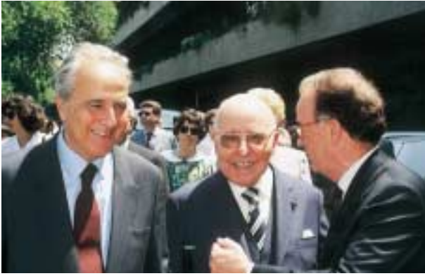
Julho de 1997 – Com António Ferrer Correia e o Presidente da República, Jorge Sampaio após a inauguração do monumento de homenagem a José de Azeredo Perdigão.