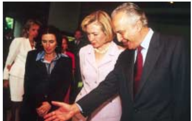
Julho de 1997 – Visita de Hillary Clinton ao Museu Gulbenkian.