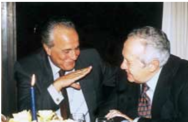
2000 – Com Mário Soares