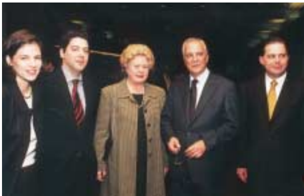
Dezembro de 1998 – Com a família na cerimónia de tomada de posse.

NEWSLETTER Nº 37. JULHO. 2002 ISSN 0873-5980