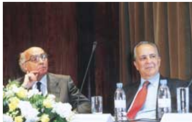
Junho 2000 – Conferência “A Língua Portuguesa no virar do Milénio – Encontro com José Saramago”.