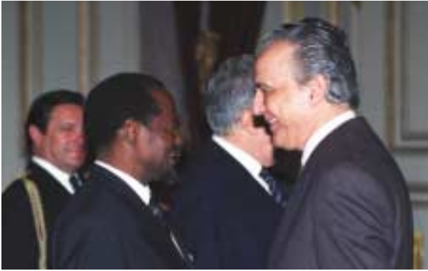
1981 – Com o Presidente de Moçambique, Joaquim Chissano.