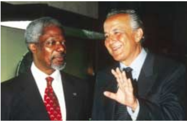
Outubro de 1998 – Visita ao Museu Gulbenkian do Secretário Geral da ONU, Kofi Annan