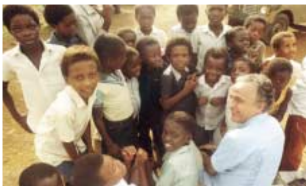
Durante uma visita a Angola.