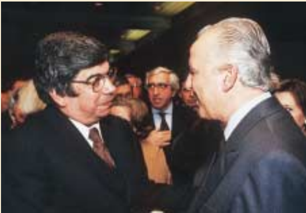
Com o Ministro do Trabalho e da Solidariedade, Eduardo Ferro Rodrigues.

com adequação e no tempo próprio a esses sinais e a esses estímulos. E responder no tempo próprio é para as Fundações ter de responder muitas vezes num tempo ainda e só adivinhado, porque para as Fundações o tempo próprio é o próprio do futuro.