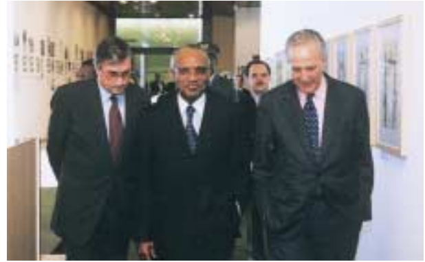
2000 – Acompanhado por Eduardo Marçal Grilo durante a visita de Miguel Trovoada, Presidente de S. Tomé e Príncipe, à Fundação.