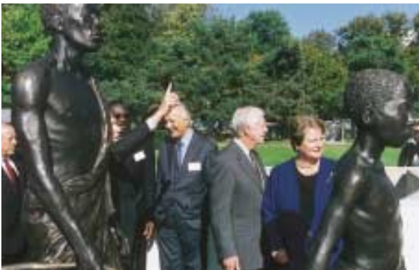
Outubro de 1999 – Sede da OMS, em Genebra, na inauguração de uma estátua comemorativa do sucesso do combate à Oncocercose, com Jimmy Carter e Gro Brundtland.

de Coimbra; Universidade de Columbia (Nova Iorque) e Fundação Konrad Adenauer (Bona). Integrou missões Parlamentares às antigas R.F.A. e U.R.S.S.